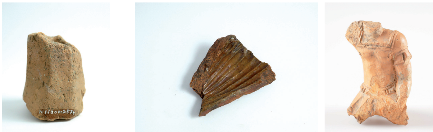
Figur 3 visar (fr. v.) en mångkantig ljusstake (M 17000-2576), en del av en aladåbform (M 17000-2567) samt en av tre delar till en ryttarstatyett i rödgods (M 17000-2544).

Kärl av totalt fem olika godstyper har identifierats, vilket är få i jämförelse med liknande slottsmiljöer. Dessutom var en stor andel av kärlden grytor och köksutrustning av rödgods och endast en mindre andel var serveringskärl som kan representera en högreståndsmiljö. Gustav Vasas försvarsborg förändrades succesivt till en befäst slottsbyggnad efter år 1558, då en kunglig herresal byggdes. År 1589 byggdes också en ny exklusiv frustuga och tillsammans med Johan den III:s estetiska program för de svenska slotten, blev den om- och tillbyggda biskopsborgen till slut en mindre slottsanläggning. Trots att kera-