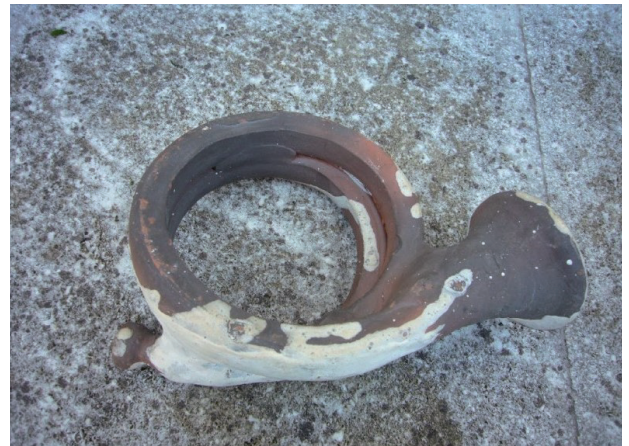
Figur 4 visar (fr. v.) delen av det snurrade hornet (M 17000-2330), samt en liknande komplett kopia från Frankrike.

miken representerar den här sista delen av slottets historia, speglar dess sammansättning att Kronoberg var en försvarsanläggning med administrativa och rättsliga uppgifter och endast i mindre grad en plats för högadlig och kunglig representation.