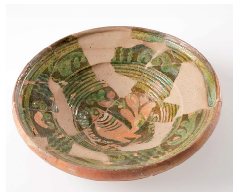
Figur 2 fr: vänster. Exempel på en hel trefotsgryta från Hallands kulturhistoriska museum. Handtag och del av buken av en trefotsgryta från Kronobergs slottsruin (M 17000-1014). Exempel på rekonstruerat tuppfat från Kronobergs slottsruin (M 17000-2246).